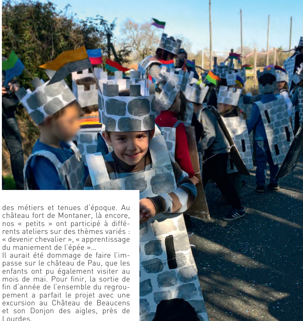
+ Nos historiens « en herbe » en pleine parade du carnaval à Sévignacq .