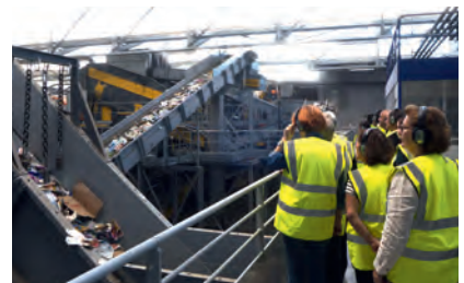
+ Les Doumyens à la découverte du centre de tri lors de la visite du 6 juin.

a pu se rendre compte de la pénibilité de cette tâche et l'importance de notre geste initial respectant les consignes de tri ! Au final, séparées par matières, les balles sont envoyées dans les usines de recyclage qui les utilisent comme produit de base. Autant de matières premières qui ne seront pas prélevées sur les ressources naturelles. Les autres déchets sont envoyés à l'incinérateur de Lescar avec nos ordures ménagères. Le tri doit devenir un acte citoyen ! ■